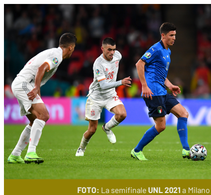
FOTO: La semifinale UNL 2021 a Milano