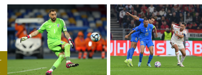
FOTO: Donnarumma, 47 gare per 4.042', Bonucci, 43 gare per 3587'.