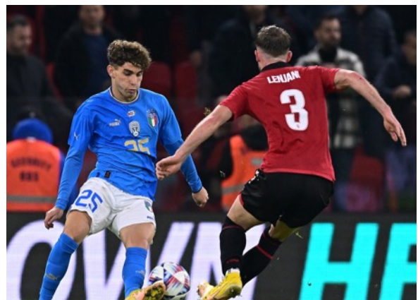
FOTO: Pafundi, all'esordio in Albania, il più giovane dal 1911.

Balotelli, Belotti, Berardi, Bernardeschi, Cancellieri, Caprari, Caputo, Chiesa, Cutrone, El Shaarawy, Giovinco, Gnonto, Grifo, Immobile, Insigne, Joao Pedro, Kean, Lasagna, Okaka, Orsolini, Pafundi, Pavoletti, Pellegri, Pinamonti, Politano, Raspadori, Retegui, Scamacca, Quagliarella, Verdi, Zaccagni, Zaza, Zerbin.