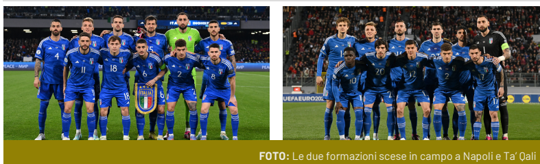
FOTO: Le due formazioni scese in campo a Napoli e Ta' Qali