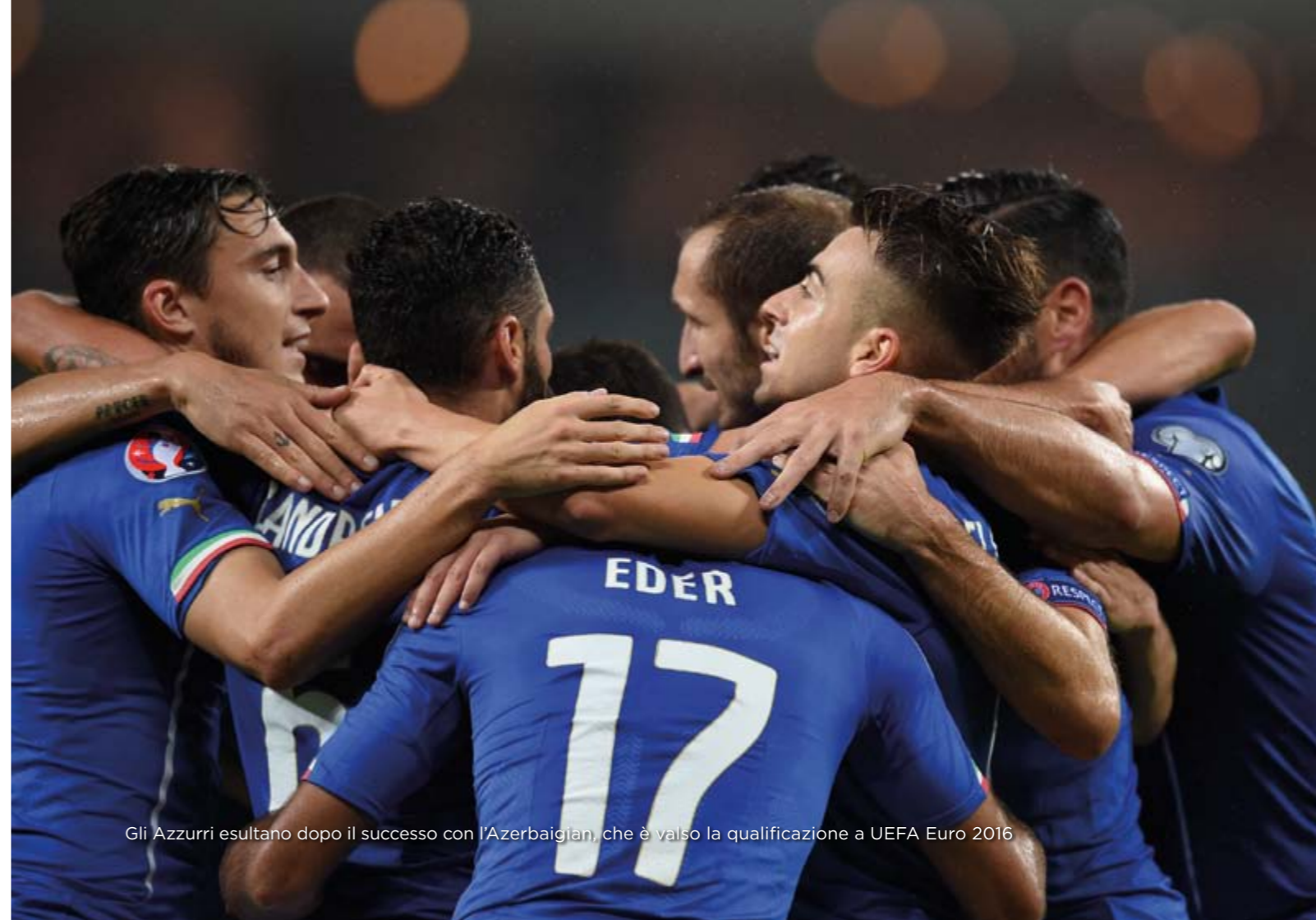
Gli Azzurri esultano dopo il successo con l'Azerbaigian, che è valso la qualificazione a UEFA Euro 2016

Si qualificano a UEFA EURO 2016 le prime due di ciascuno degli 8 gironi e la migliore terza classificata. Le altre 8 terze classificate si affronteranno in una fase play off che qualificherà 4 squadre