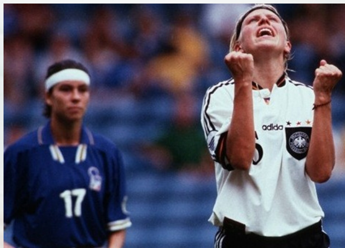
1997: l'Italia è sconfitta in finale dalla Germania

Nel 1984 e nel 1995 non c'è stata una fase finale ma un primo turno di qualificazione a gironi e poi confronti ad eliminazione diretta con gare di andata e ritorno. In entrambi i casi, l'Italia ha passato il turno perdendo poi