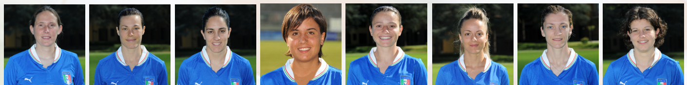
Tona Camporese Domenichetti Parisi Stracchi Rosucci Tuttino Brumana