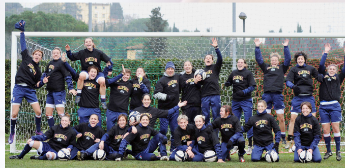
La Nazionale a Coverciano con la maglia celebrativa di Euro 2013

Data di nascita: 08/02/1975 Luogo: Roma Club: ASD Torres Presenze: 184 Reti: 98 Esordio in Nazionale: 19/03/1995 Gara: Portogallo - Italia 1-4